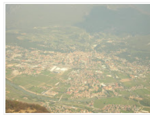
220 m slm