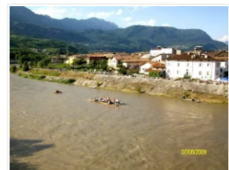
Borgo Sacco Rovereto Vallagarina ZATTERATA