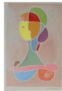
opera dell'artista trentino Maurizio Larcher